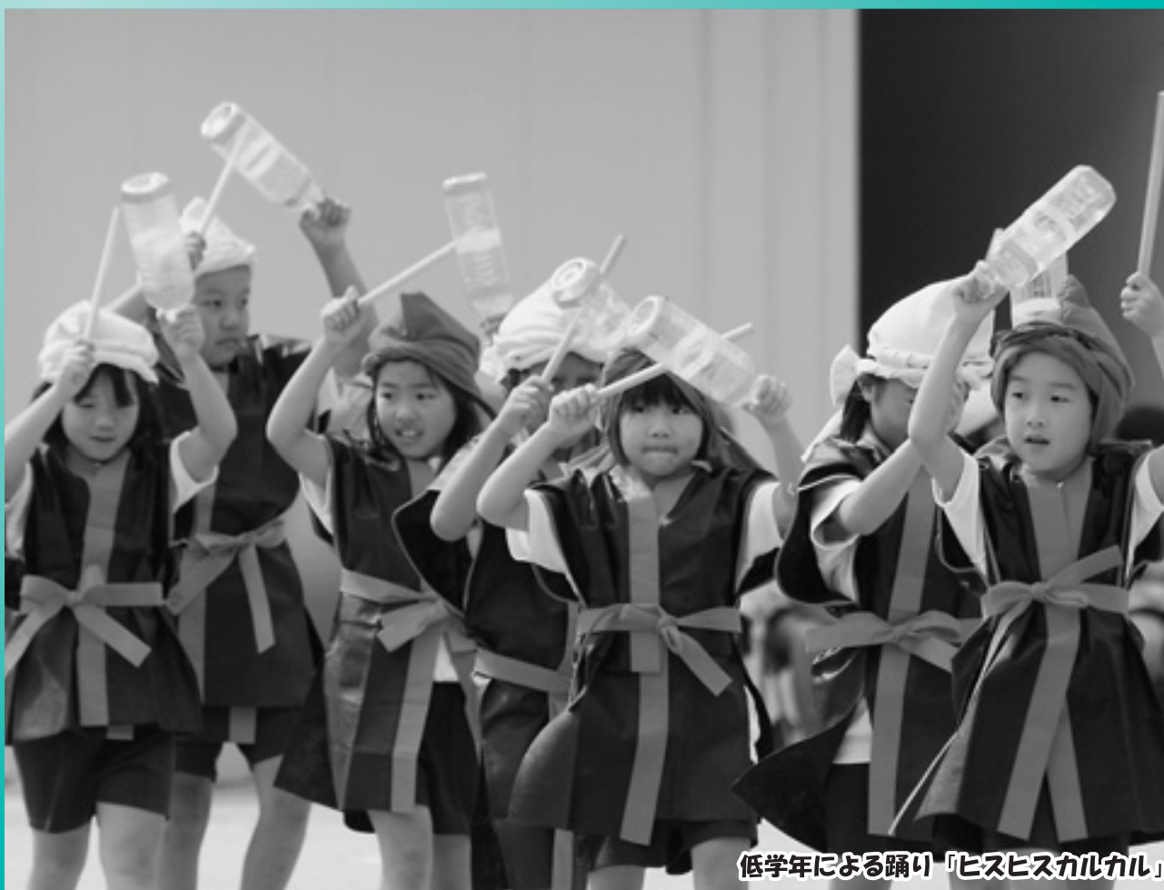
低学年による踊り「ヒスヒスカルカル」

発行 奈良県吉野郡下北山村役場 Tel(代)07468-6-0001 http://www.vill.shimokitayama.nara.jp/